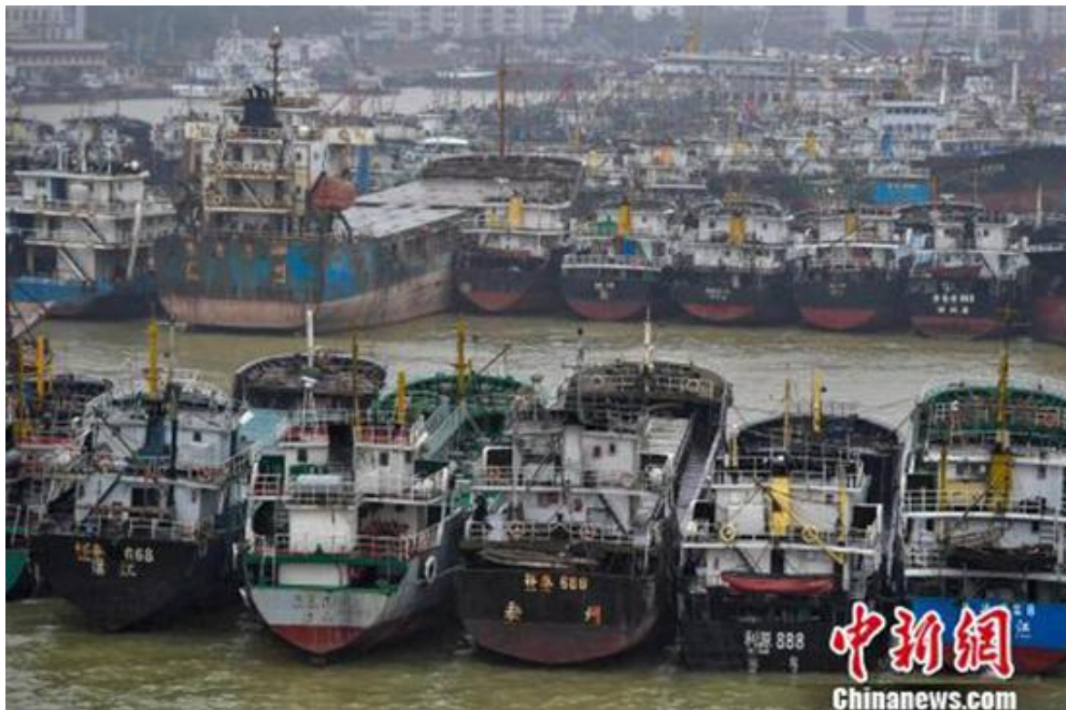
海口新港码头停靠着众多回港避风的船只。 中新网 图

海南省防指于14日22时将防汛防台风应急响应提升至II级，全省有24272艘渔船回港避风，转移渔排职员57764人、危险区域职员61412人。